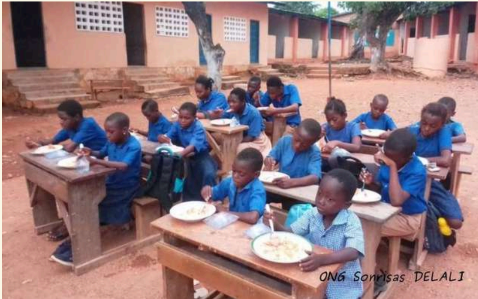
Beneficiados en el colegios de Kpalimé (Togo). Curso 2022-23