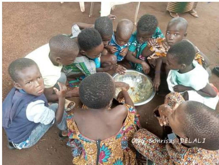
Niños y niñas beneficiados en la zona rural de Ghana compartiendo una comida