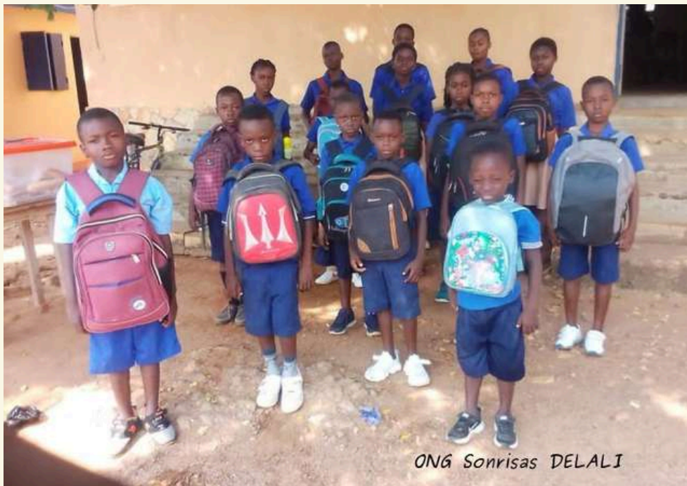
16 niñas y niños benficiados de Kpalimé (Togo)