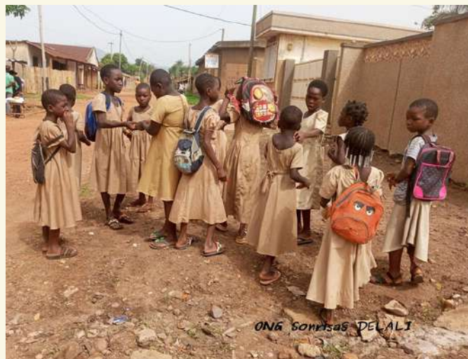
Niñas y niños beneficiados con Becas Escolares 2022-23