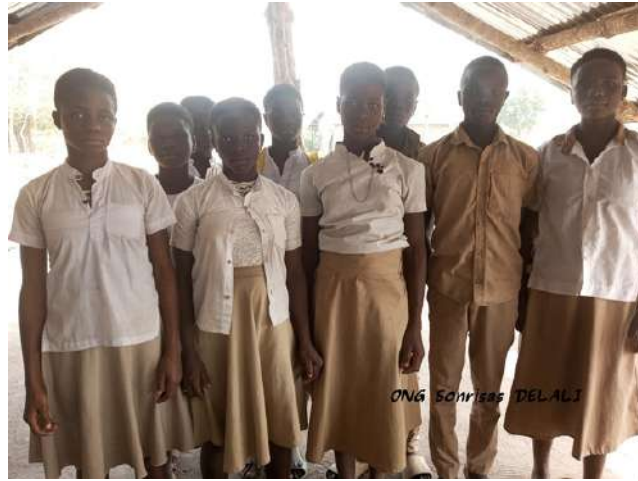
Niñas y niños beneficiados en Togo