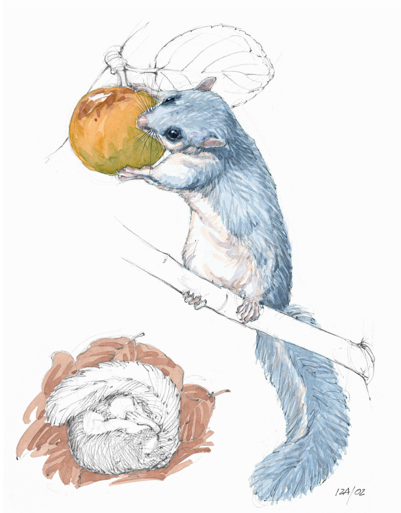
Lirón ( Glis glis ) dibujado por Iñaki Zorrakin, 2002 ©