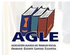
Agle Asociación Alavesa de Trabajo Social