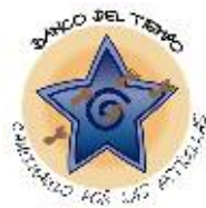
Banco del Tiempo