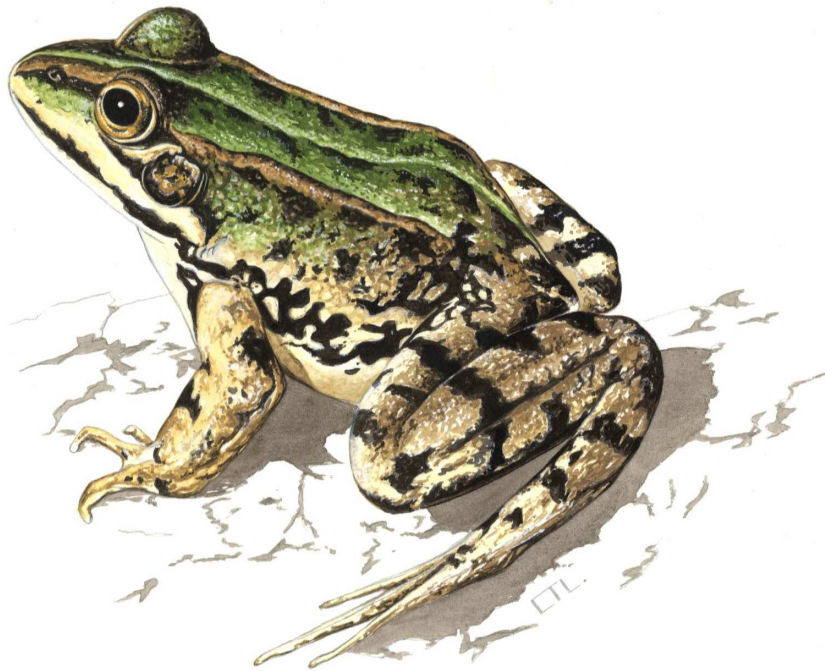
Ur-igel arrunta ( Pelophylax perezi ) / Irudigilea: Conrado Tejado Lanseros