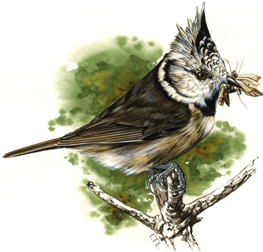
Amilotx mottoduna ( Parus cristatus ) (Irudigilea: Conrado Tejado Lanseros)