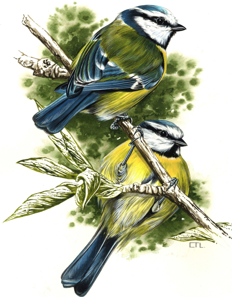
Amilotx urdina ( Parus caeruleus ) / Irudigilea: Conrado Tejado Lanseros