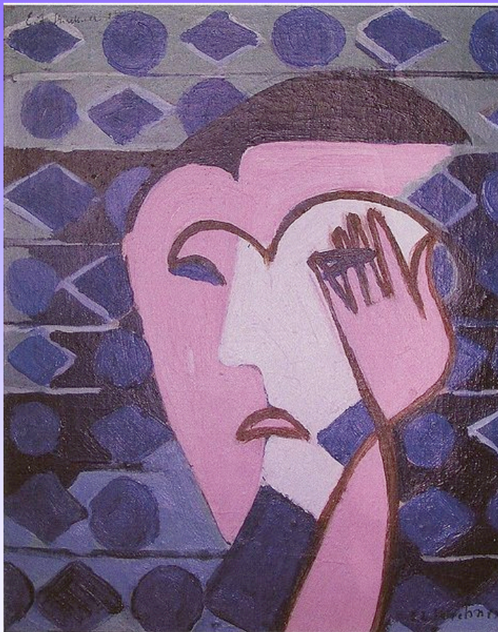
Retrato de mujer triste Ernst Ludwig Kirchner